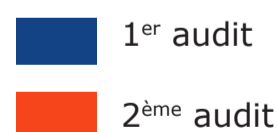
Nombre de dossiers